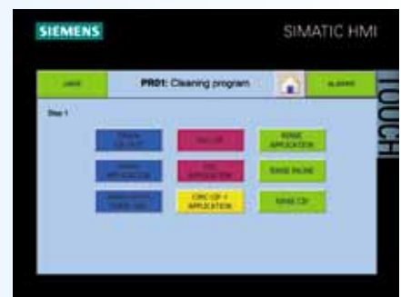
Über das Bedienungspult wählen Sie schnell das geeignete Reinigungsprogramm aus, das jeweils verschiedene Schritte umfasst. Für jeden Schritt passen Sie die zur Verfügung stehenden Parameter (Zeit, CIP-Tankinhalt, Temperatur, Leitfähigkeit usw.) flexibel an.