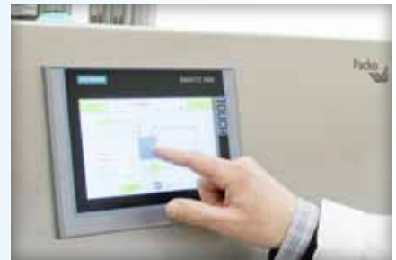
Das übersichtliche Bedienungspult sorgt für eine einfache Bedienung.