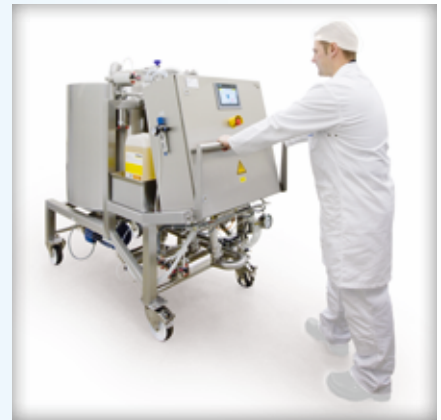
Die mobile CIP-Einheit lässt sich mühelos von einer Prozessanlage zur nächsten bewegen.

Sie können die mobile CIP-Einheit auch für eine Rückführung der Reinigungsmittel konfigurieren lassen, wodurch der Verbrauch noch weiter sinkt.